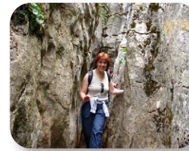
Este pasillo rocoso es un ejemplo de diaclasa o fractura que origina un típico callejón, su anchura solo permite pasar a las personas de una en una

Lo que caracteriza a esta ruta es sin duda la variedad de vegetación que podemos observar, ya que discurre por zonas más umbrías que albergan, entre otras, plantas como los líquenes, helechos, musgos de varias especies, hiedras, zarzas y ciertas rupícolas (que crecen entre las grietas y son endémicas de las sierras béticas). Siguiendo el trazado del itinerario señalizado por el llamado callejón del tabaco el sendero nos lleva hasta una depresión del terreno que en el Torcal se denomina dolina, donde volvemos a unirnos con la ruta verde. En este punto de encuentro observaremos a nuestra izquierda un singular arce de Montpellier [11] que en épocas estivales presenta una frondosa copa. Pasada la roca “el Robot” [12] comenzamos la ligera ascensión que nos llevará de nuevo hasta el Centro de Visitantes por los hoyos de la burra y de la ruca.