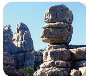
A lo largo del recorrido veremos cómo la erosión del viento, del hielo y del agua ha esculpido formas capichosas en la roca caliza