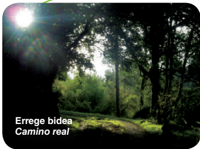
Errege bidea Camino real